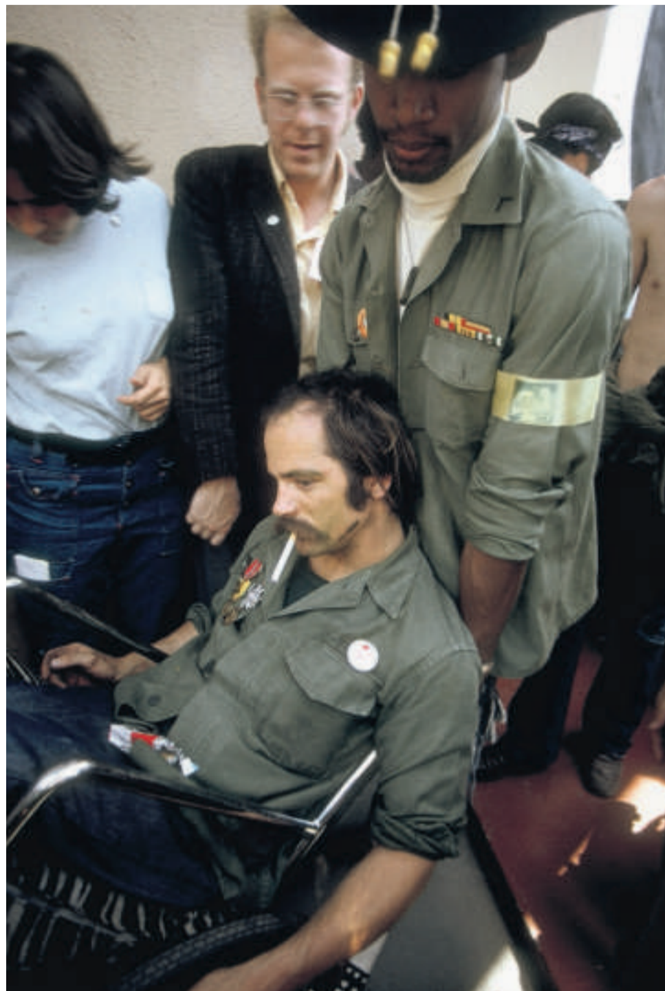
Die Diagnose Kriegstrauma bekamen zuerst Vietnamveteranen: Ron Kovic, dessen Leben als «Geboren am 4. Juli» verfilmt wurde, an einem Friedensmarsch. (22. 4. 1972)

Dass nicht mehr nur Soldaten, sondern ab dem 20. Jahrhundert auch Zivilisten als Opfer gelten, ist internationalen Regelungen wie den Haager Abkommen von 1899 und 1907 zu verdanken, in deren Folge von Kriegsverbrechen die Rede war, wenn die Zivilbevölkerung zu Schaden kam. Die Bilder getöteter Zivilisten, vor allem von Kindern, halfen fortan, die eigene Kriegführung unter Verweis auf die Opfer als gerechtfertigt hinzustellen. Und als im Ersten Weltkrieg die meisten europäischen Staaten den Kriegsversehrten mehr Entschädigungen zahlten, wurde es schliesslich regelrecht attraktiv,